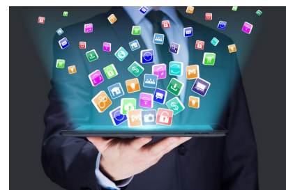
La vulnérabilité des logiciels